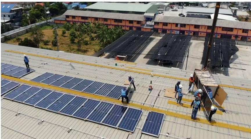
โครงการพลังงานแสงอาทิตย์