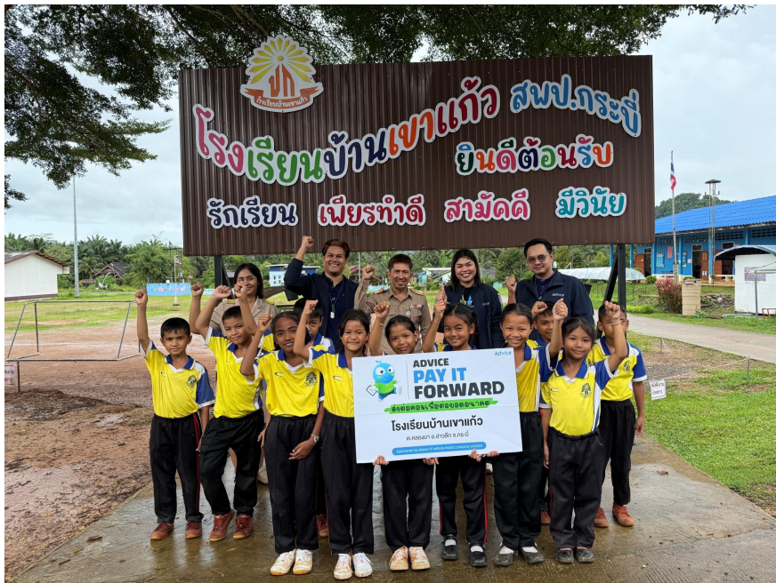
โครงการ Pay it forward