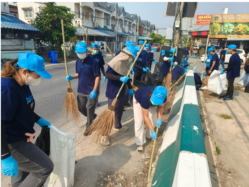
โครงการบ้านสวยด้วยมือเรา