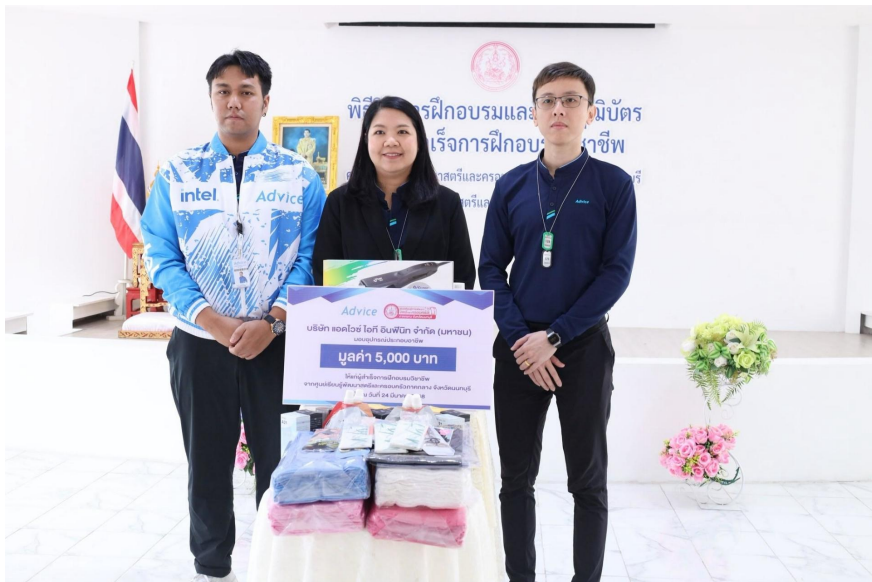
โครงการ Zero to Hero