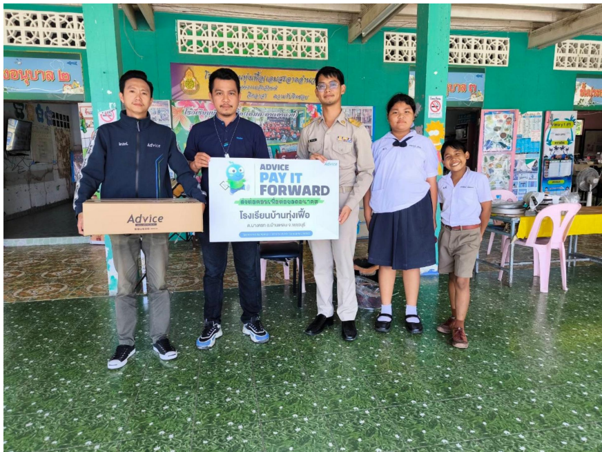
โครงการ Pay it forward