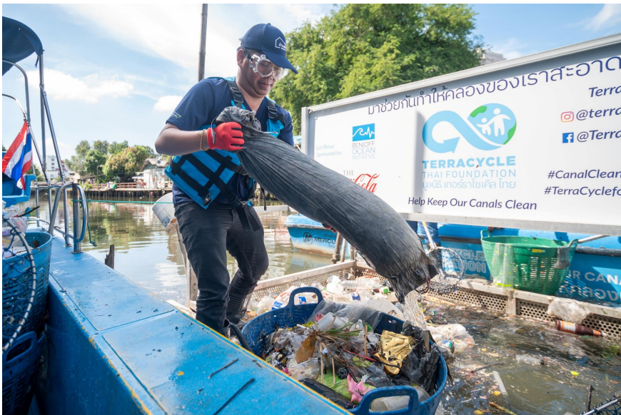
โครงการ Advice x TerraCycle