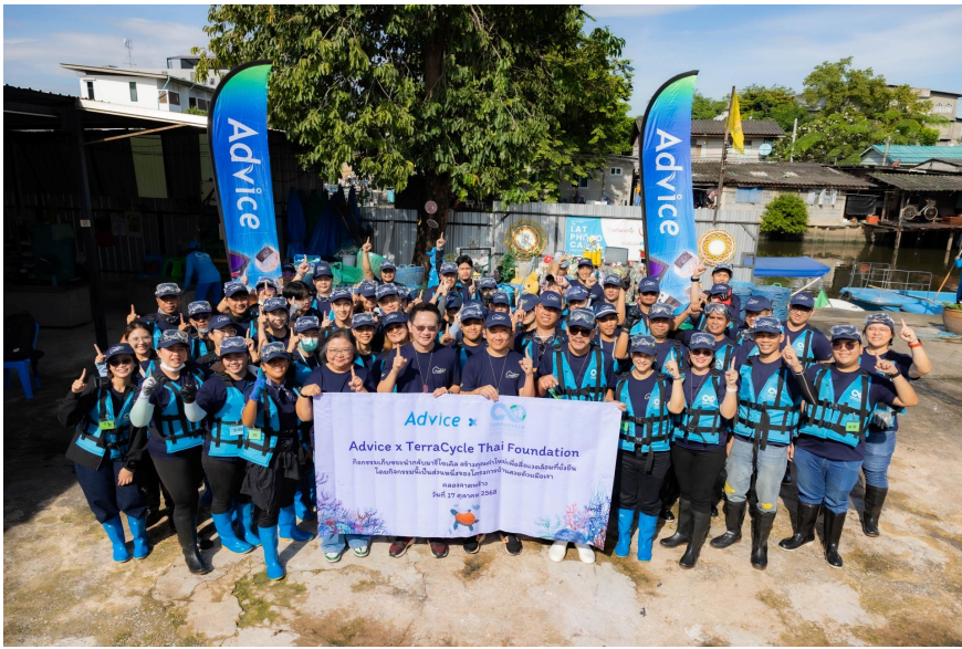
โครงการ Advice x TerraCycle