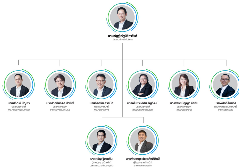
แผนภาพโครงสร้างผู้บริหาร