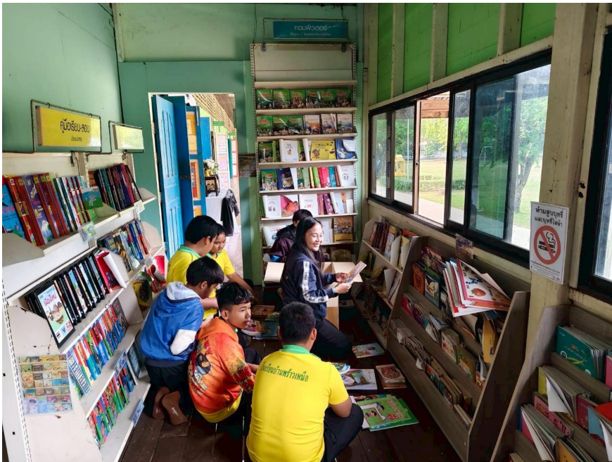
โครงการ แบ่ง ฝืน บัน อ่าน