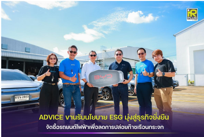
โครงการรถยนต์ไฟฟ้าเพื่อพนักงาน